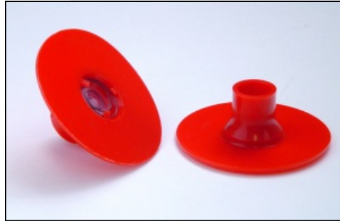
Inspuitventiel 12,2 mm Art.nr. 80540